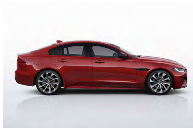
19" 'STYLE 1050' DARK GREY & CONTRAST DIAMOND TURNED FINISH Standaard op XE R-Dynamic SE