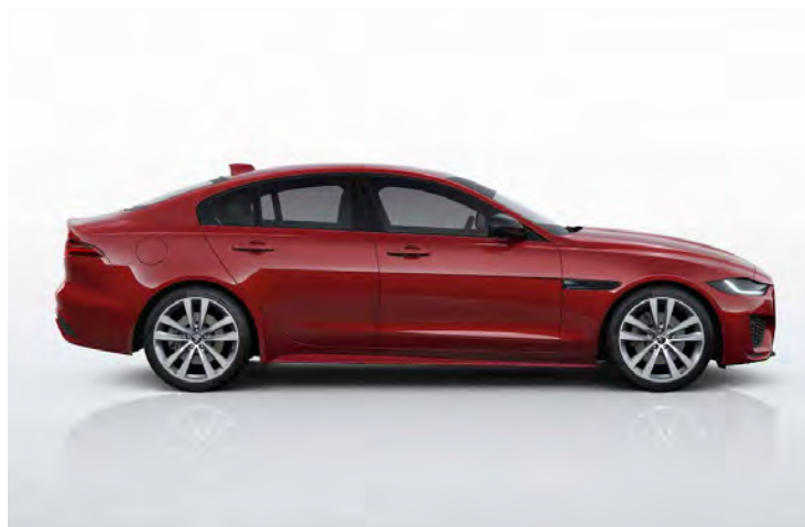
19" 'STYLE 5031' GLOSS SILVER & CONTRAST DIAMOND TURNED FINISH Standaard op XE R-Dynamic HSE