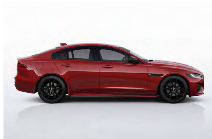
19" 'STYLE 5031' GLOSS BLACK