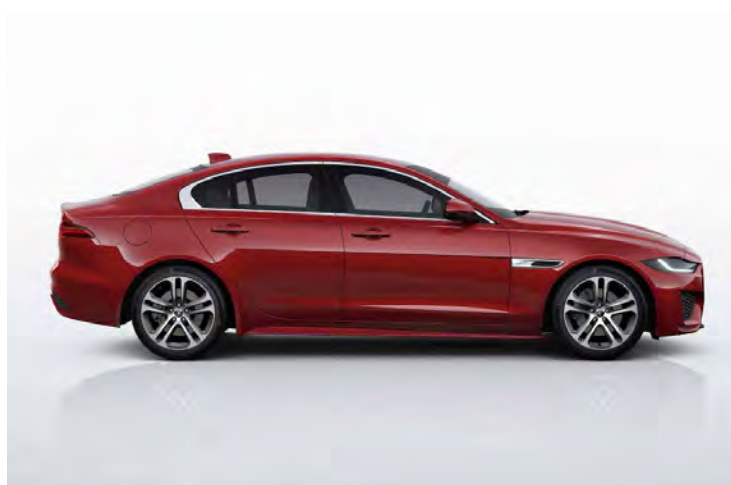
18" 'STYLE 5029' GLOSS DARK GREY & CONTRAST DIAMOND TURNED FINISH Standaard op XE R-Dynamic S

Er is keuze uit een uitgebreid programma lichtmetalen velgen. De maten variëren van 18" tot 19". De markante designkenmerken voegen stuk voor stuk hun specifieke karakter toe aan de uitstraling van de auto. In de configurator op jaguar.nl kunt u zien welke velgen beschikbaar zijn voor uw gewenste uitvoering.