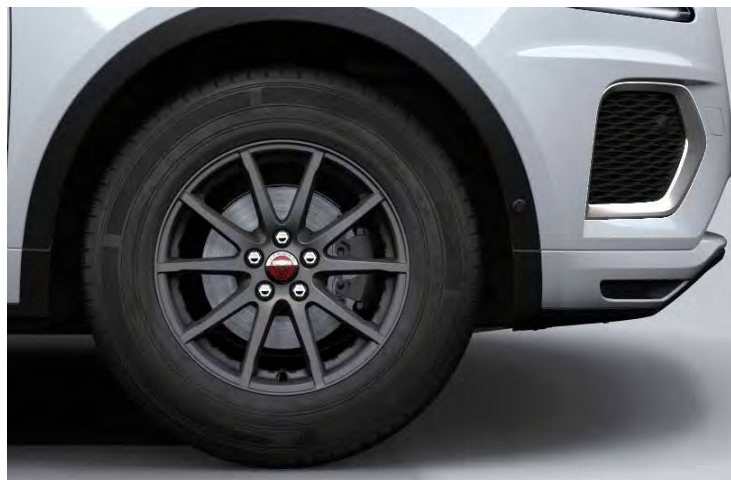
17" 'STYLE 1005' SATIN DARK GREY

Er is keuze uit een uitgebreid programma lichtmetalen velgen. De maten variëren van 17" tot 21". De markante designkenmerken voegen stuk voor stuk hun specifieke karakter toe aan de uitstraling van de auto. In de configurator op jaguar.nl kunt u zien welke velgen beschikbaar zijn voor uw gewenste uitvoering.