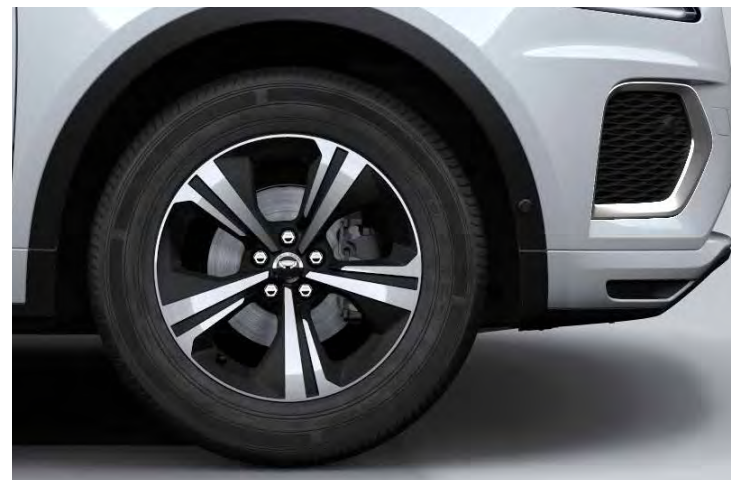
18" 'STYLE 5118' SATIN BLACK & CONTRAST DIAMOND TURNED FINISH Standaard op E-PACE R-Dynamic S