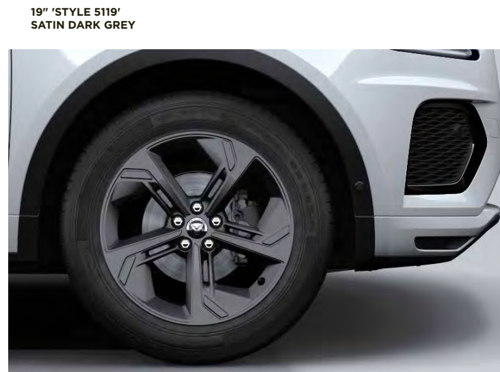
19" 'STYLE 5119' SATIN DARK GREY