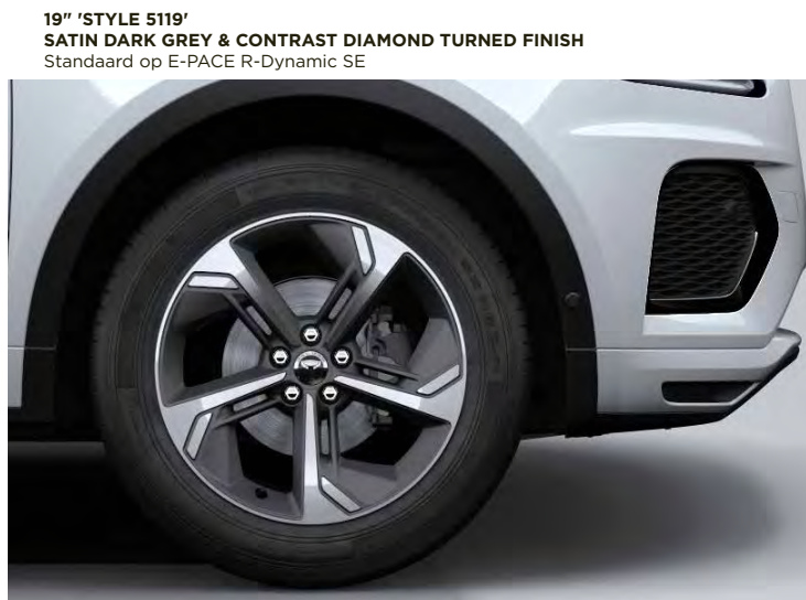
19" 'STYLE 5119' SATIN DARK GREY & CONTRAST DIAMOND TURNED FINISH Standaard op E-PACE R-Dynamic SE